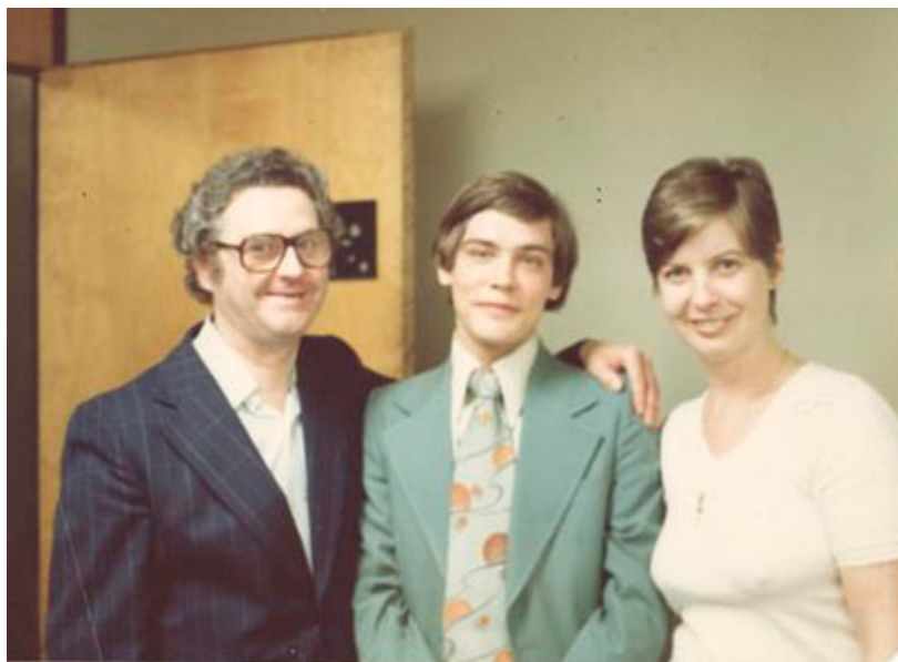
TAKEN IN MONTREAL, CANADA ON MAY 7TH, 1978