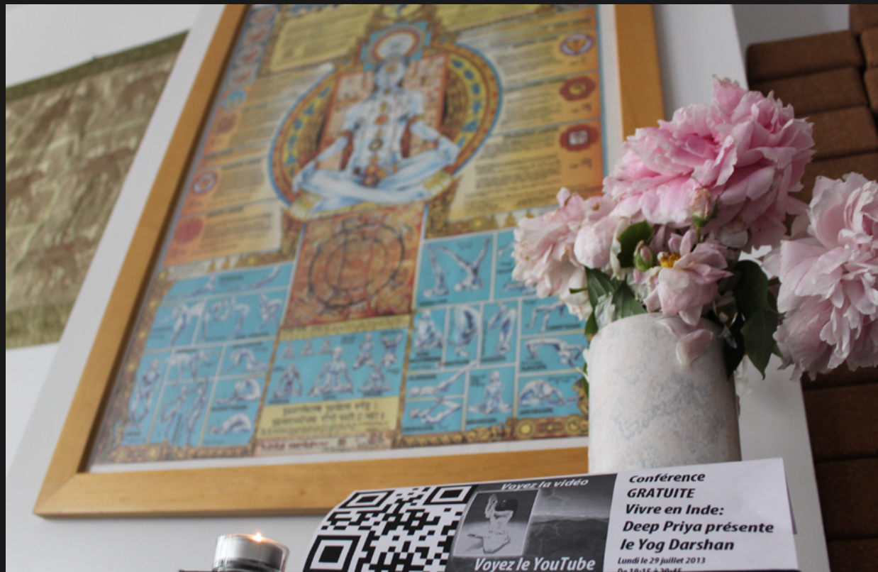
Un CD des sutras de Patanjali

Une soirée rencontre avait été organisée, voici quelques photos d'archives